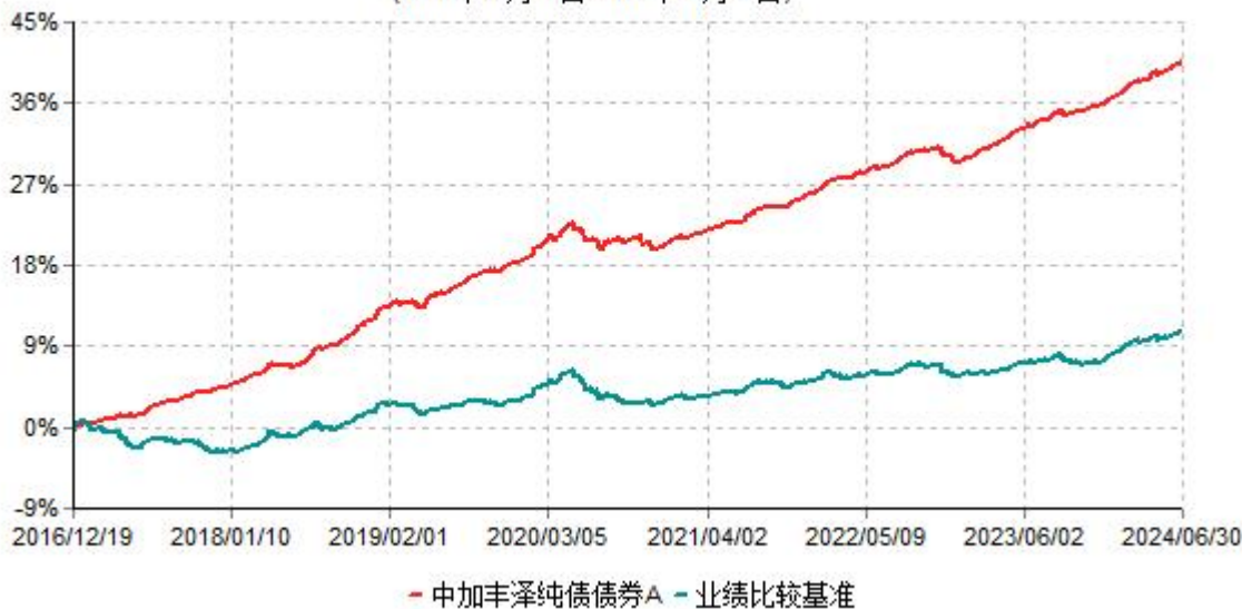
中加丰泽纯债债券A累计净值增长率与业绩比较基准收益率历史走势对比图 (2016年12月19日-2024年06月30日)