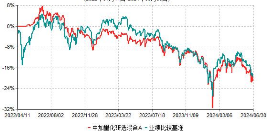
中加量化研选混合A累计净值增长率与业绩比较基准收益率历史走势对比图 (2022年04月11日-2024年06月30日)