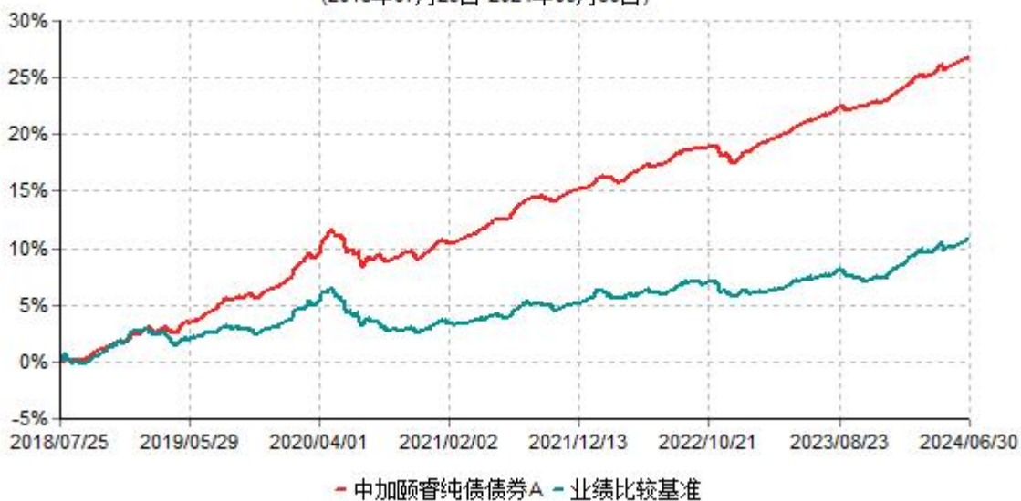
中加颐睿纯债债券A累计净值增长率与业绩比较基准收益率历史走势对比图 (2018年07月25日-2024年06月30日)