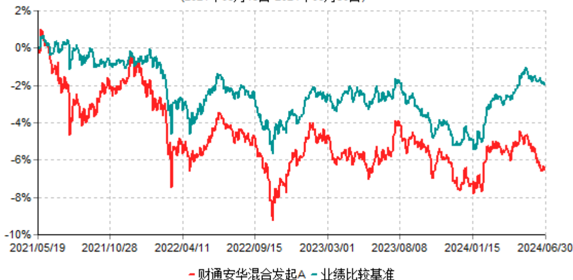
财通安华混合发起A累计净值增长率与业绩比较基准收益率历史走势对比图 (2021年05月19日-2024年06月30日)