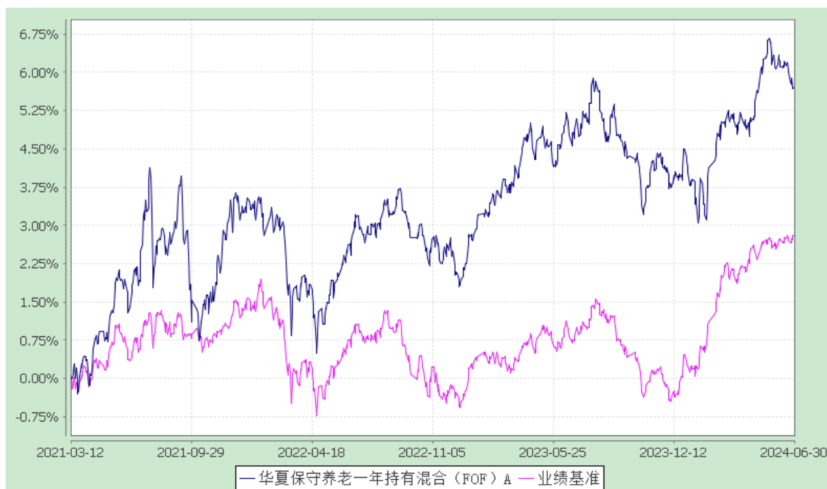
华夏保守养老一年持有混合（FOF）Y：