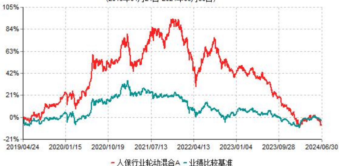
人保行业轮动混合A累计净值增长率与业绩比较基准收益率历史走势对比图 (2019年04月24日-2024年06月30日)