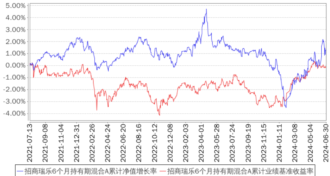
招商瑞乐6个月持有期混合A累计净值增长率与同期业绩比较基准收益率的历史走势对比图