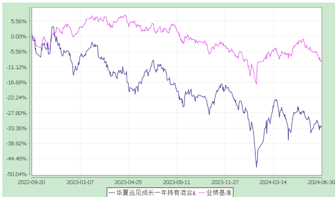
华夏远见成长一年持有混合 C: