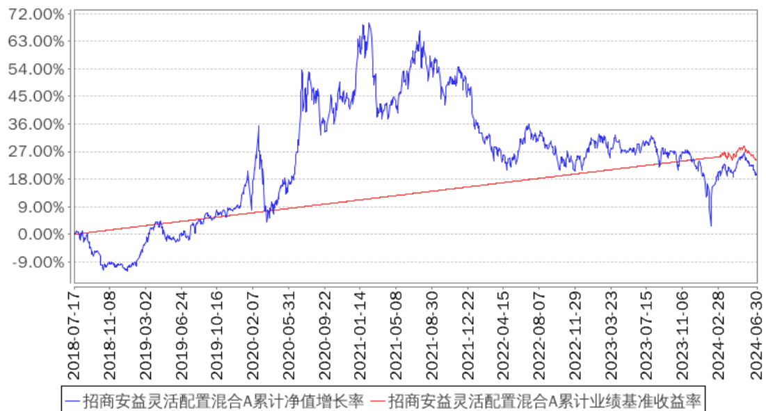
招商安益灵活配置混合A累计净值增长率与同期业绩比较基准收益率的历史走势对比图