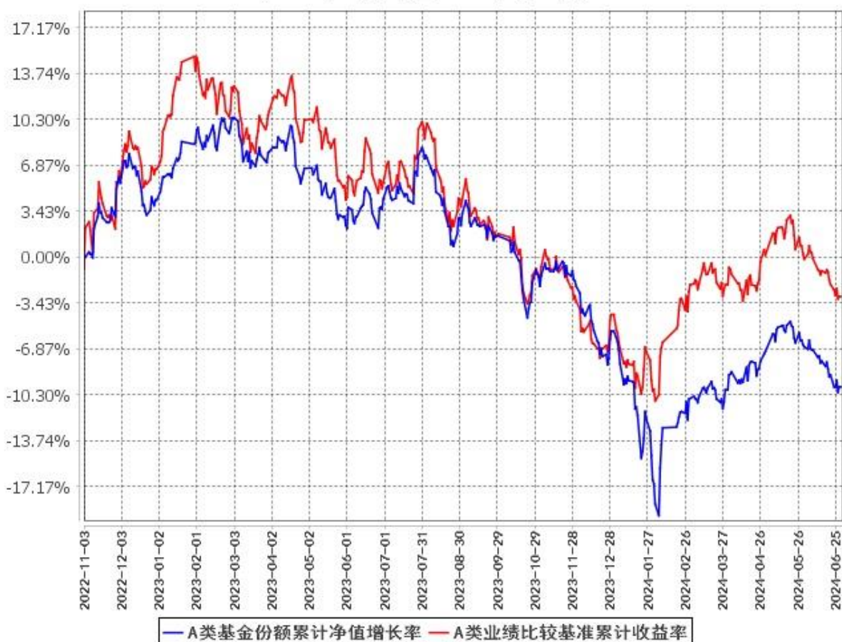
A类基金份额累计净值增长率与同期业绩比较基准收益率的历史走势对比图 (2022年11月3日至2024年6月30日)