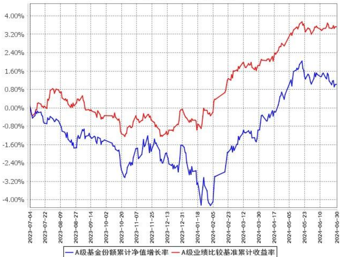
A级基金份额累计净值增长率与同期业绩比较基准收益率的历史走势对比图 (2023年7月4日至2024年6月30日)