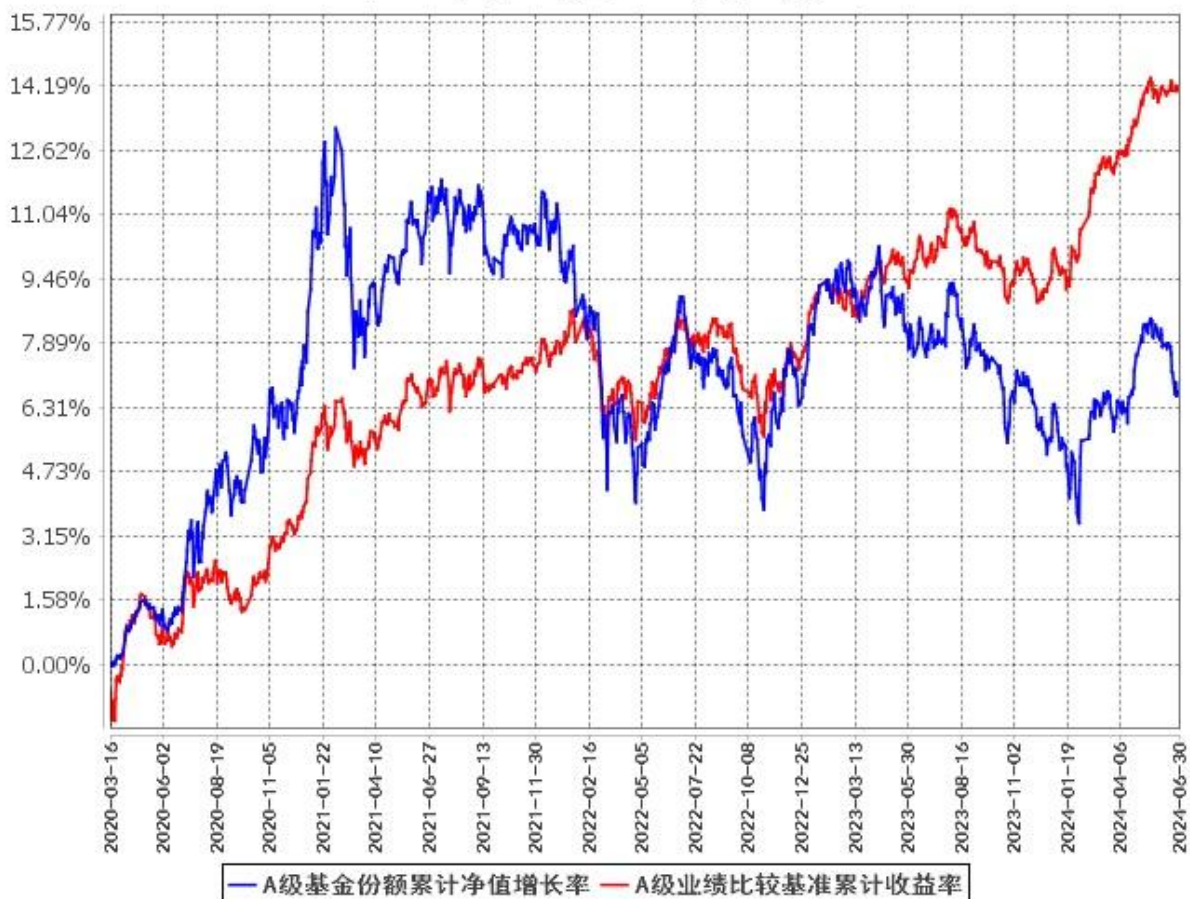
A级基金份额累计净值增长率与同期业绩比较基准收益率的历史走势对比图 (2020年3月16日至2024年6月30日)