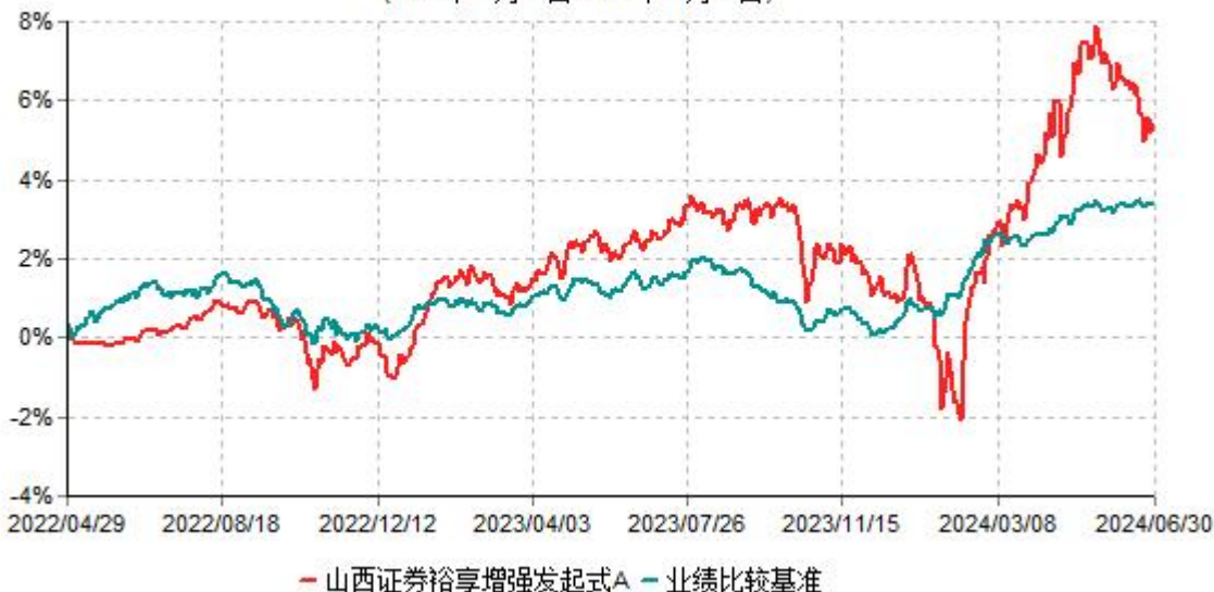
山西证券裕享增强发起式A累计净值增长率与业绩比较基准收益率历史走势对比图 (2022年04月29日-2024年06月30日)