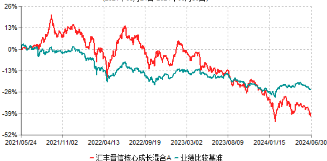
汇丰晋信核心成长混合A累计净值增长率与业绩比较基准收益率历史走势对比图 (2021年05月24日-2024年06月30日)