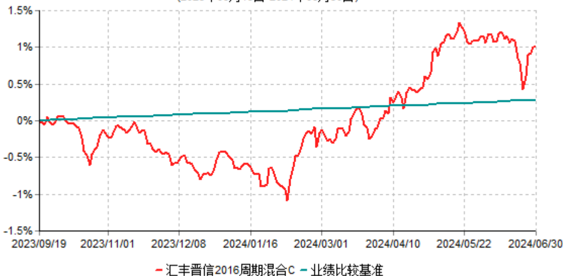
汇丰晋信2016周期混合C累计净值增长率与业绩比较基准收益率历史走势对比图 (2023年09月19日-2024年06月30日)