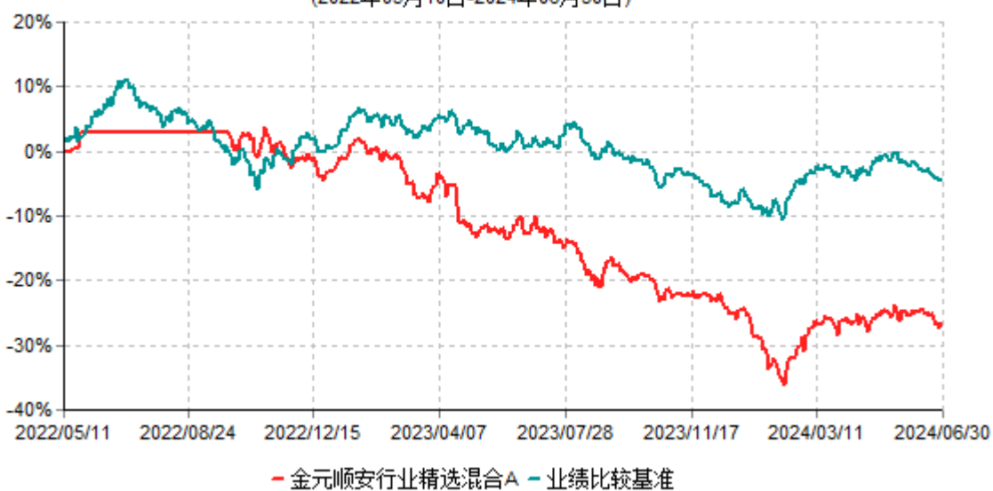
金元顺安行业精选混合A累计净值增长率与业绩比较基准收益率历史走势对比图 (2022年05月10日-2024年06月30日)