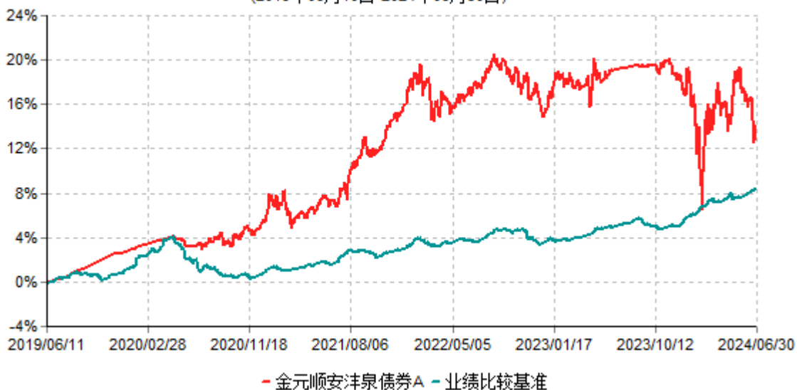
金元顺安沅泉债券A累计净值增长率与业绩比较基准收益率历史走势对比图 (2019年06月10日-2024年06月30日)