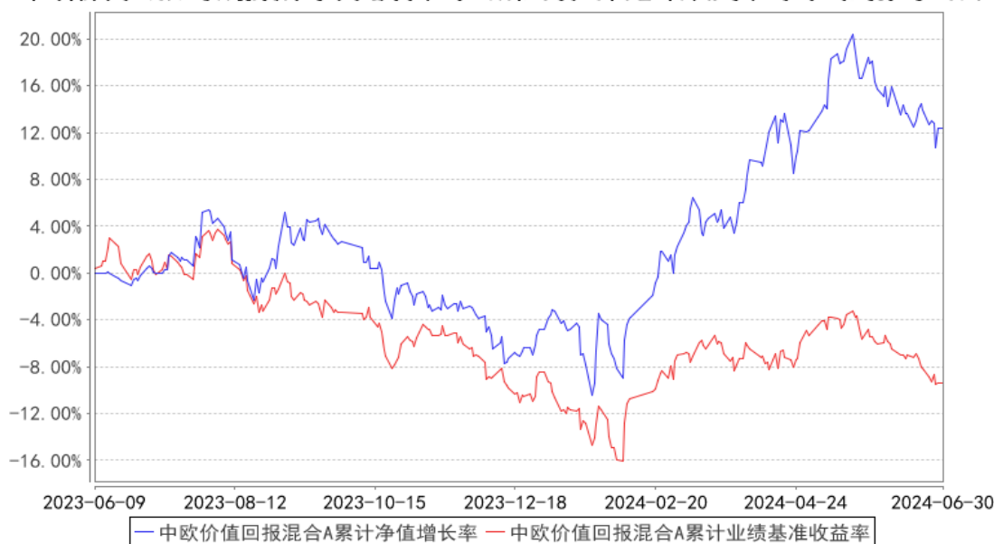
中欧价值回报混合A累计净值增长率与同期业绩比较基准收益率的历史走势对比图

注：本基金基金合同生效日期为 2023 年 6 月 9 日，按基金合同的规定，本基金自基金合同生效起六个月为建仓期，建仓期结束时各项资产配置比例已经符合基金合同约定。