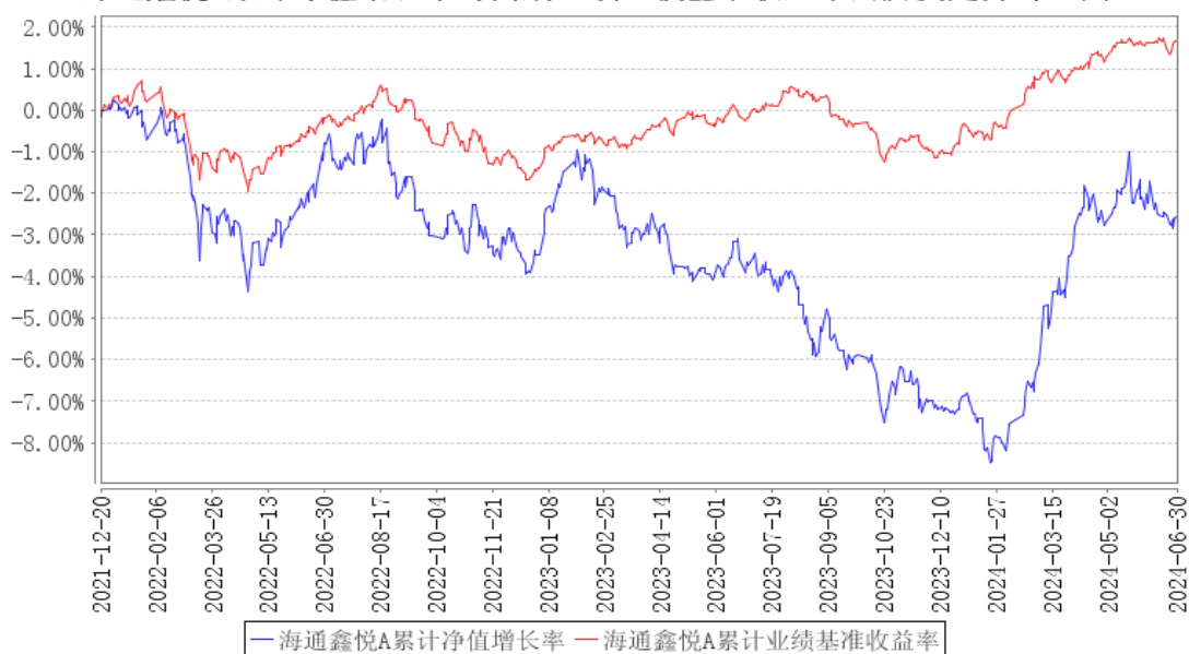
海通鑫悦A累计净值增长率与同期业绩比较基准收益率的历史走势对比图