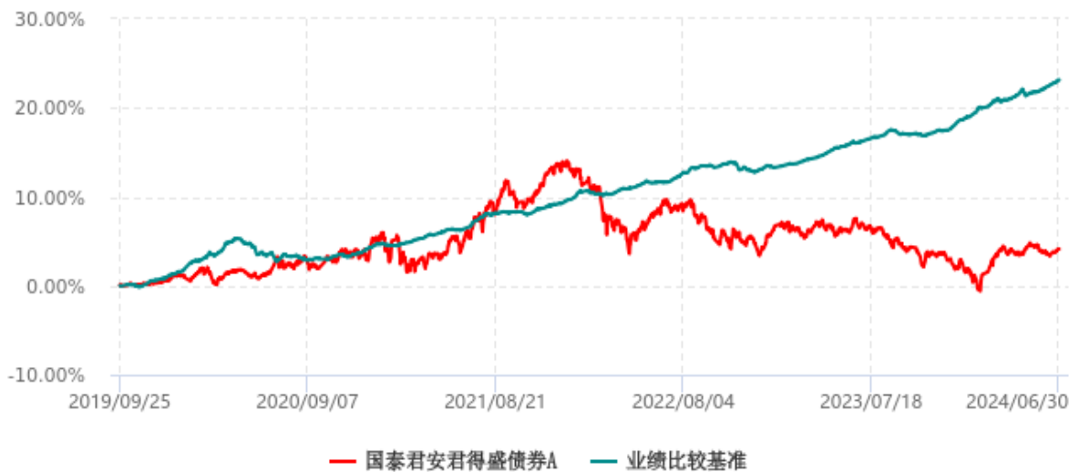
国泰君安君得盛债券A累计净值增长率与业绩比较基准收益率历史走势对比图 (2019年09月25日-2024年06月30日)