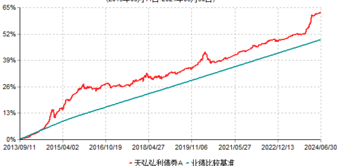
天弘弘利债券A累计净值增长率与业绩比较基准收益率历史走势对比图 (2013年09月11日-2024年06月30日)