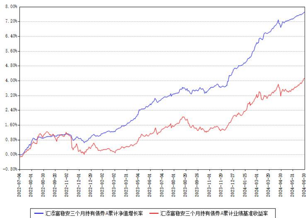
汇添富稳安三个月持有债券A累计净值增长率与同期业绩比较基准收益率对比图