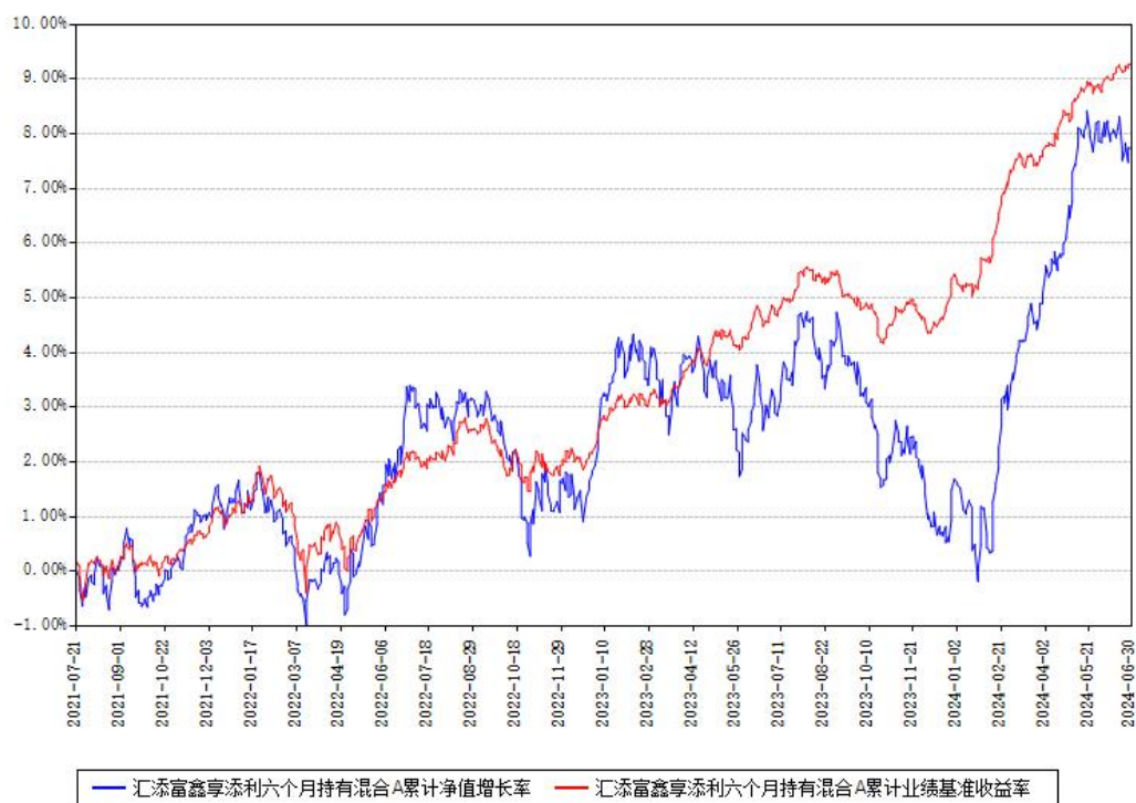
汇添富鑫享添利六个月持有混合A累计净值增长率与同期业绩比较基准收益率对比图