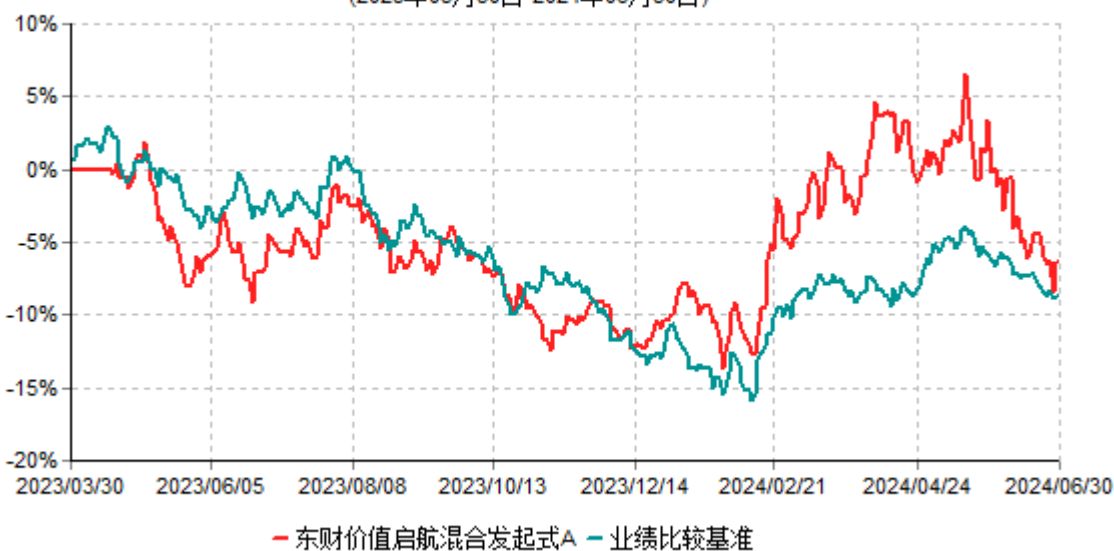
东财价值启航混合发起式A累计净值增长率与业绩比较基准收益率历史走势对比图 (2023年03月30日-2024年06月30日)