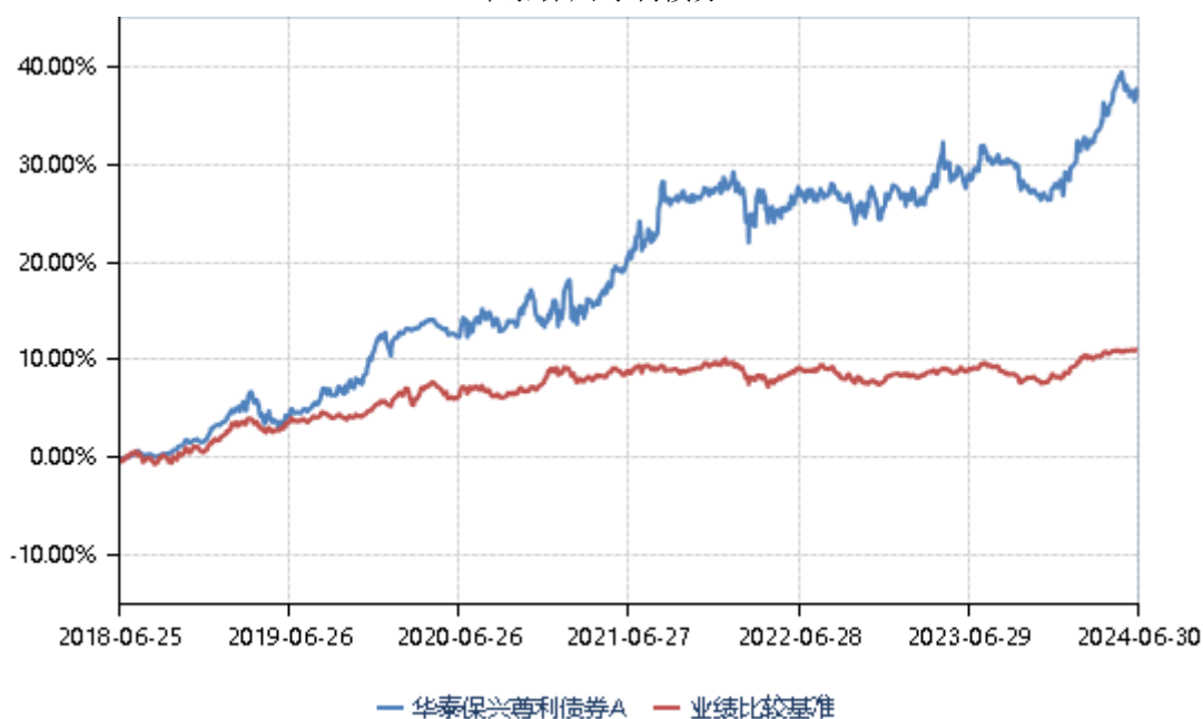
华泰保兴尊利债券 A