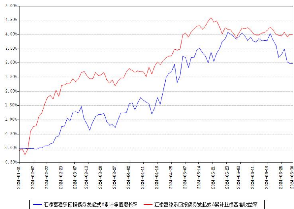
汇添富稳乐回报债券发起式A累计净值增长率与同期业绩比较基准收益率对比图