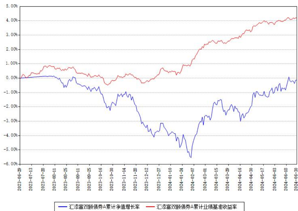
汇添富双颐债券A累计净值增长率与同期业绩比较基准收益率对比图