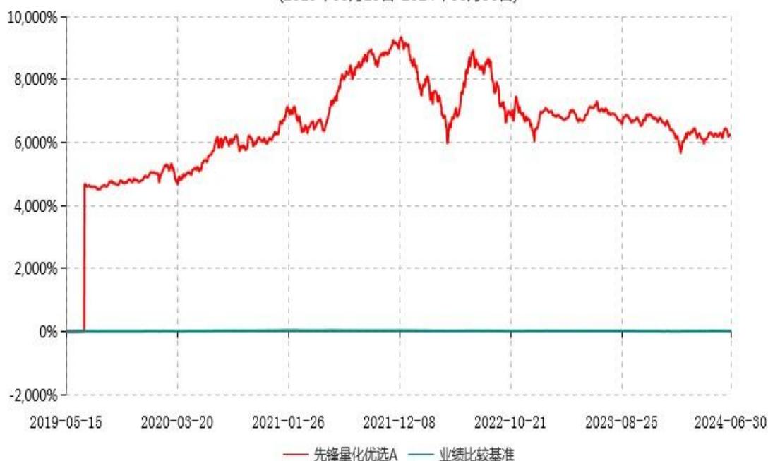
先锋量化优选A累计净值增长率与业绩比较基准收益率历史走势对比图 (2019年05月15日-2024年06月30日)