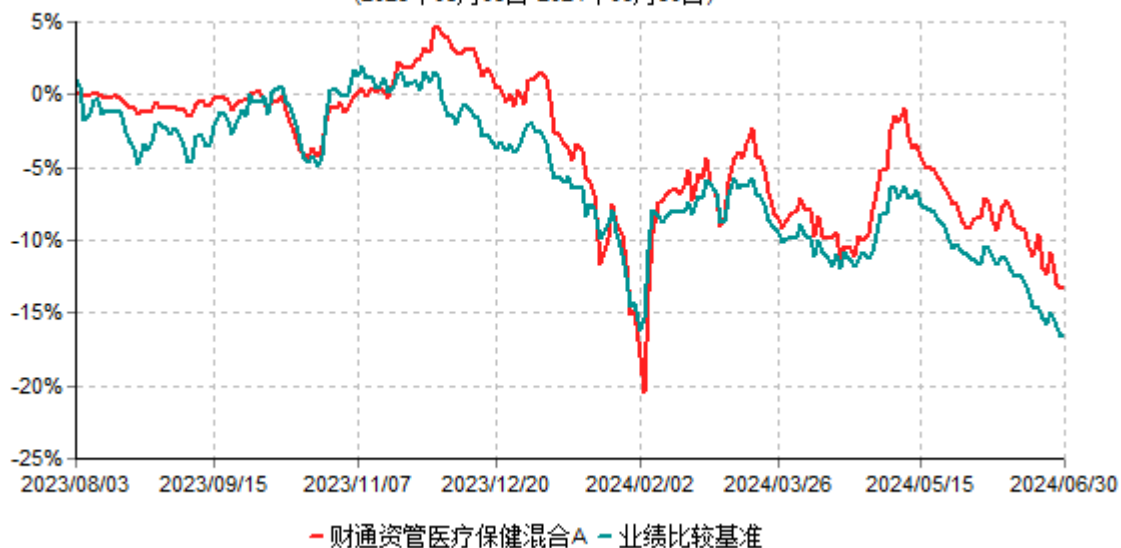
财通资管医疗保健混合A累计净值增长率与业绩比较基准收益率历史走势对比图 (2023年08月03日-2024年06月30日)