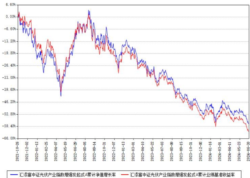
汇添富中证光伏产业指数增强发起式A累计净值增长率与同期业绩基准收益率对比图