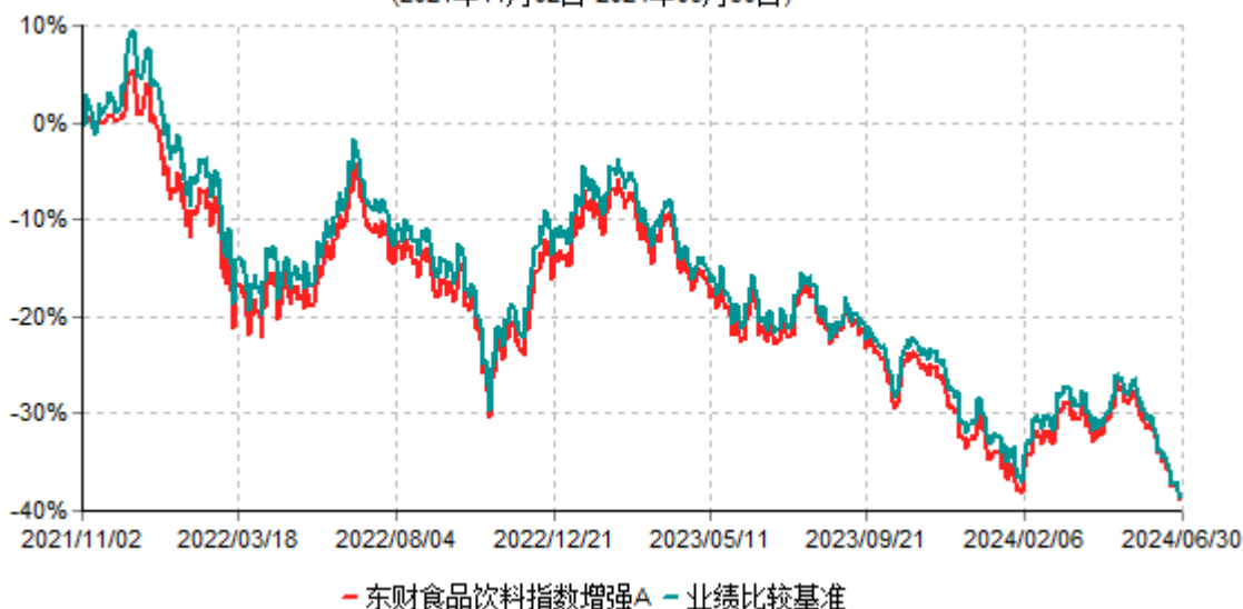
东财食品饮料指数增强A累计净值增长率与业绩比较基准收益率历史走势对比图 (2021年11月02日-2024年06月30日)