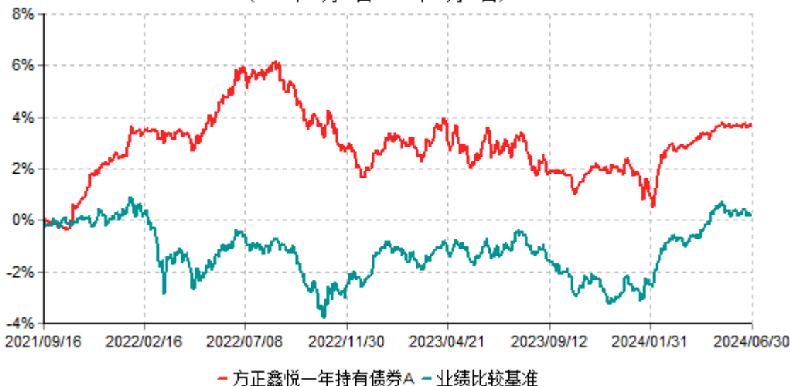
方正鑫悦一年持有债券A累计净值增长率与业绩比较基准收益率历史走势对比图 (2021年09月16日-2024年06月30日)