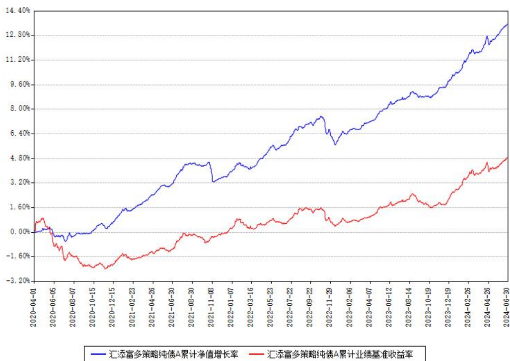
汇添富多策略纯债A累计净值增长率与同期业绩基准收益率对比图