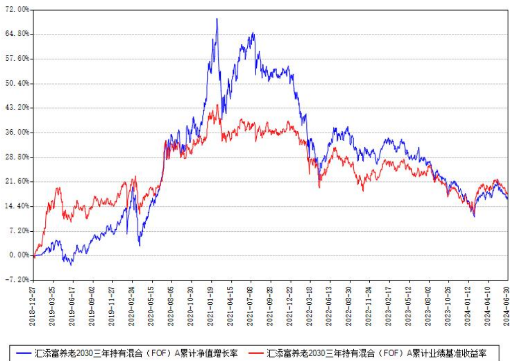
汇添富养老2030三年持有混合（FOF）A累计净值增长率与同期业绩比较基准收益率对比图