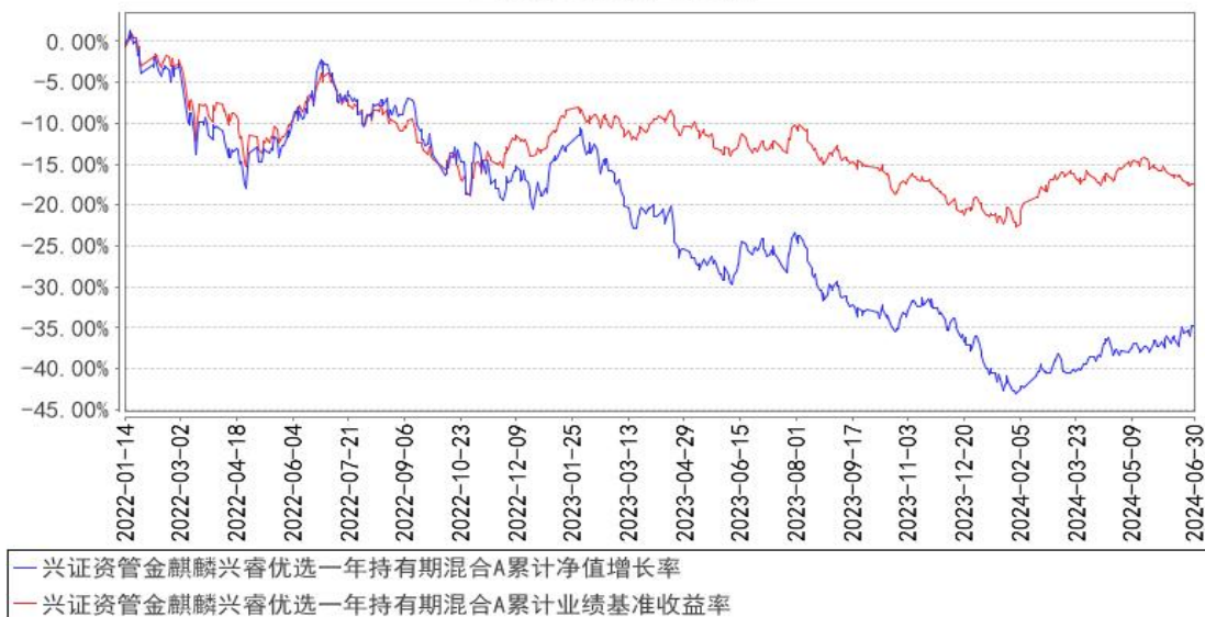
兴证资管金麒麟兴睿优选一年持有期混合A累计净值增长率与同期业绩比较基准收益率的历史走势对比图