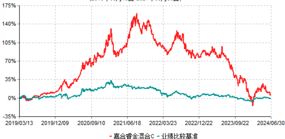
嘉合睿金混合C累计净值增长率与业绩比较基准收益率历史走势对比图 (2019年03月13日-2024年06月30日)