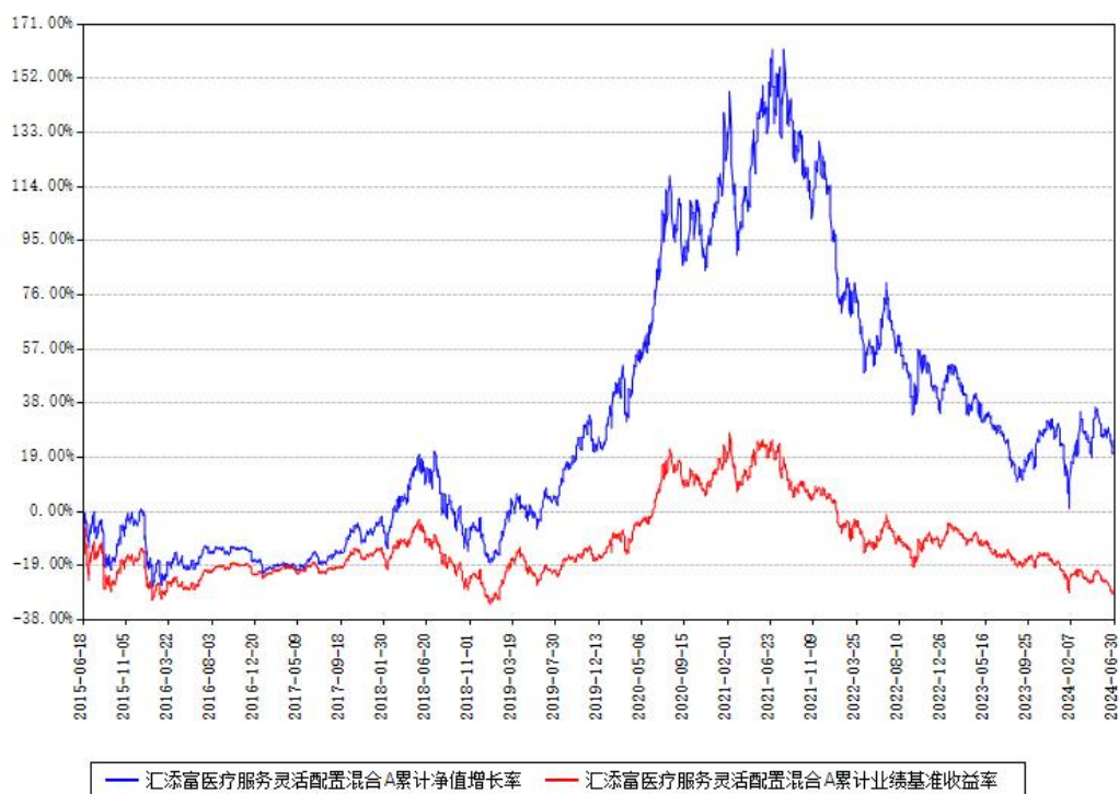
汇添富医疗服务灵活配置混合A累计净值增长率与同期业绩基准收益率对比图