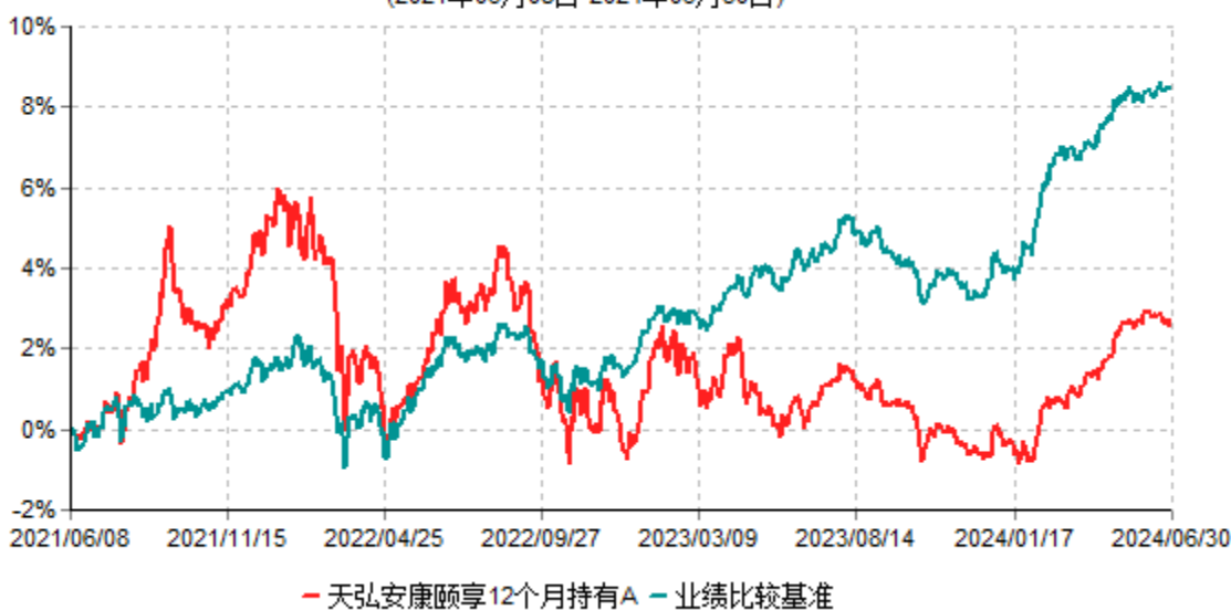
天弘安康颐享12个月持有A累计净值增长率与业绩比较基准收益率历史走势对比图 (2021年06月08日-2024年06月30日)