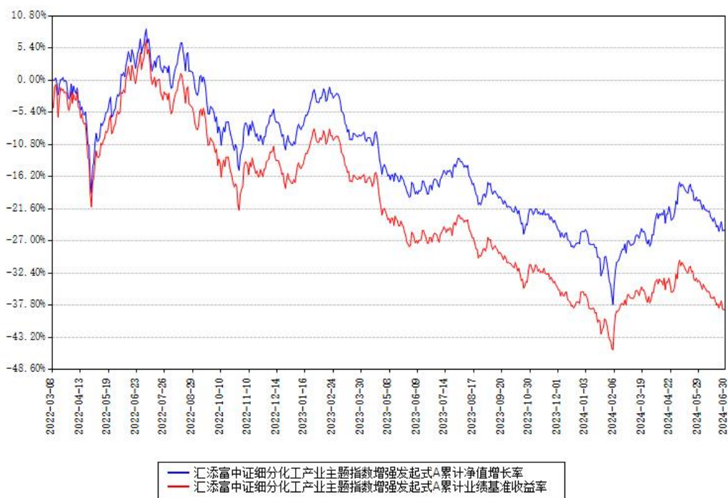
汇添富中证细分化工产业主题指数增强发起式A累计净值增长率与同期业绩比较基准收益率对比图