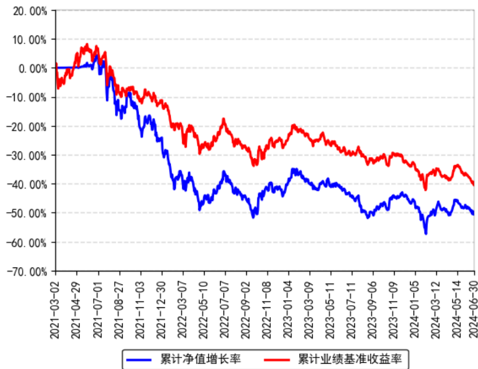
南方医药创新股票A累计净值增长率与同期业绩比较基准收益率的历史走势对比图