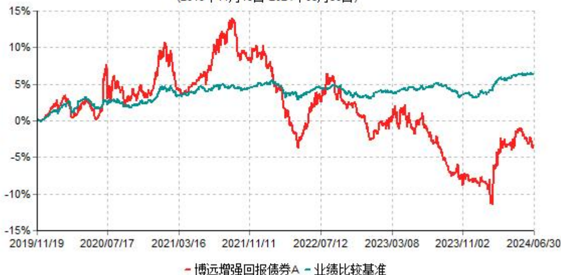
博远增强回报债券A累计净值增长率与业绩比较基准收益率历史走势对比图 (2019年11月19日-2024年06月30日)