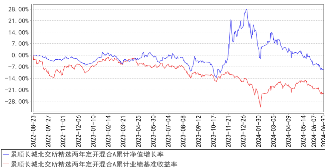
景顺长城北交所精选两年定开混合A累计净值增长率与同期业绩比较基准收益率的历史走势对比图