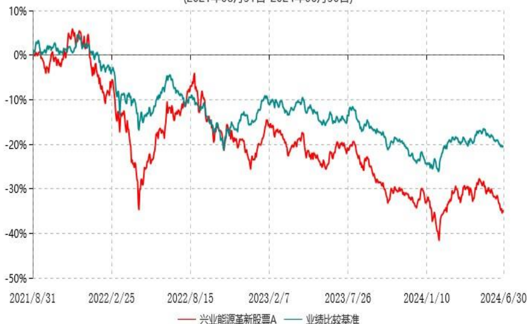
兴业能源革新股票A累计净值增长率与业绩比较基准收益率历史走势对比图 (2021年08月31日-2024年06月30日)