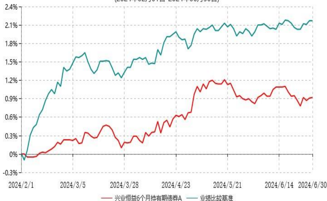
兴业恒益6个月持有期债券A累计净值增长率与业绩比较基准收益率历史走势对比图 (2024年02月01日-2024年06月30日)

注：1、本基金基金合同于 2024 年 2 月 1 日生效，截至报告期末本基金基金合同生效未 满一年。