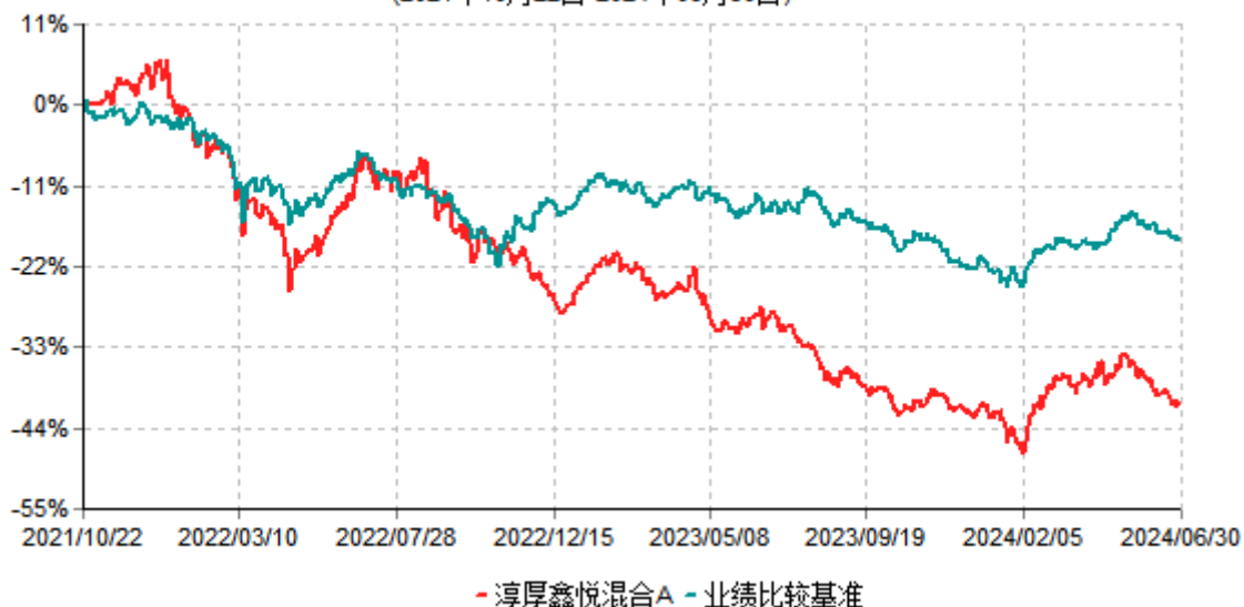
淳厚鑫悦混合A累计净值增长率与业绩比较基准收益率历史走势对比图 (2021年10月22日-2024年06月30日)

注：本基金基金合同生效日为 2021 年 10 月 22 日。按基金合同规定，本基金自基金合同生效起 6 个月内为建仓期。建仓期结束时本基金的各项投资比例均符合基金合同约定。