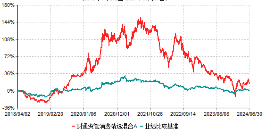
财通资管消费精选混合A累计净值增长率与业绩比较基准收益率历史走势对比图 (2018年04月02日-2024年06月30日)