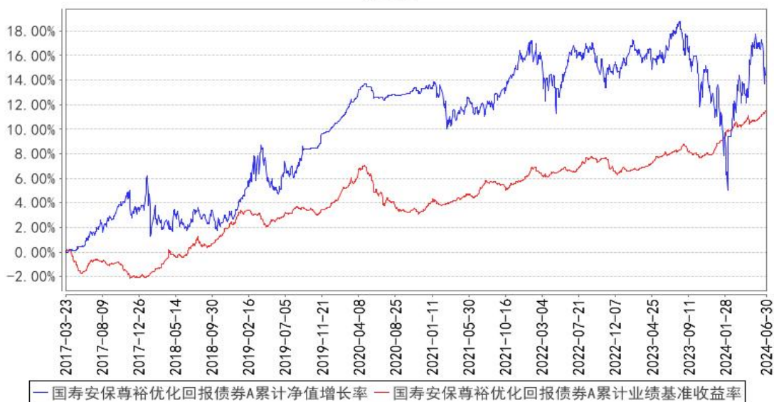
国寿安保尊裕优化回报债券A累计净值增长率与同期业绩比较基准收益率的历史走势对比图