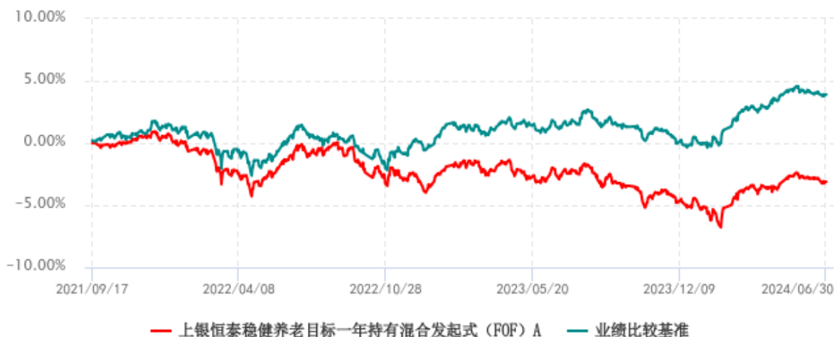
上银恒泰稳健养老目标一年持有混合发起式（FOF）A 累计净值增长率与业绩比较基准收益率历史走势对比图 (2021年09月17日-2024年06月30日)