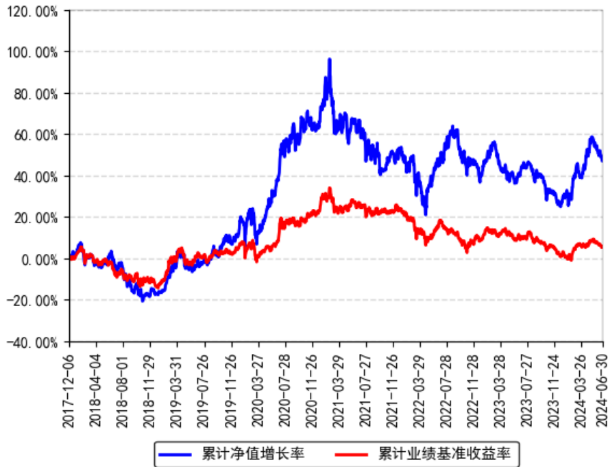
南方优享分红灵活配置混合A累计净值增长率与同期业绩比较基准收益率的历史走势对比图