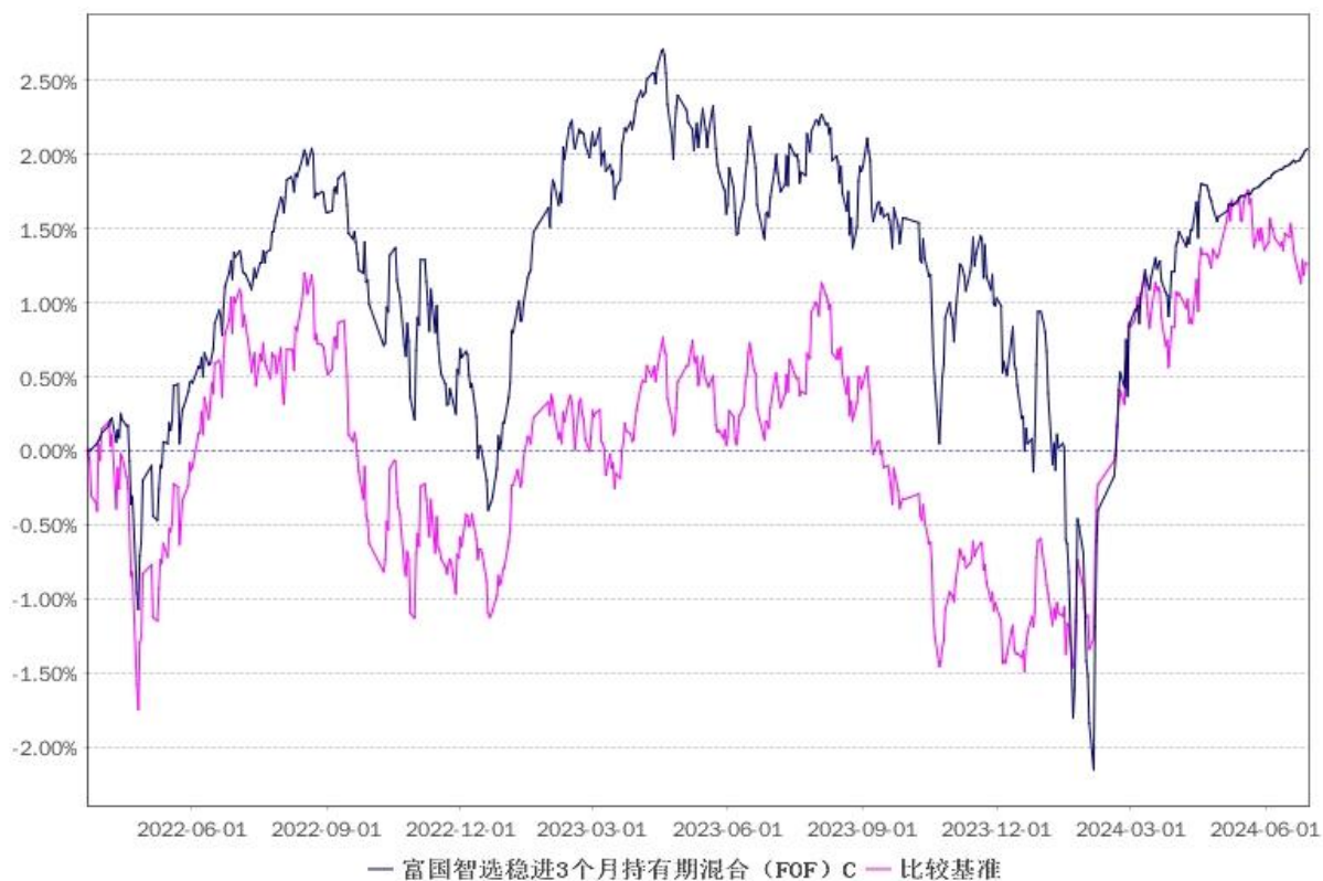
净值增长率与业绩比较基准收益率的历史走势对比图